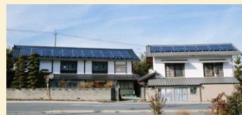
住宅 31 軒