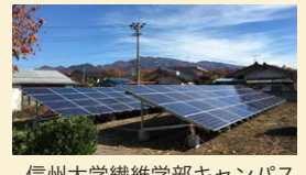
信州大学繊維学部キャンパス