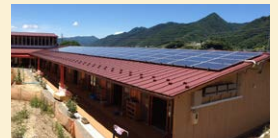
上田市神科第一保育園